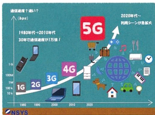
[モバイル通信環境の歴史]

今の 5G で何ができて、どんなメリットが得られ、またデメリットがあるのかと、これからの 5G について知っておくべきことを解説いたします。